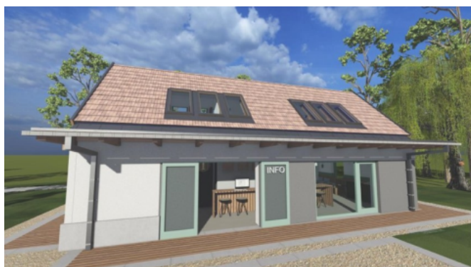
Nézet a Fő utcáról