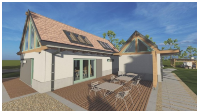
Nézet a tó felől

2022-ben átdolgoztuk a pályázati anyagot és egy megjelent új kiírásra benyújtottuk támogatási kérelmünket, melynek eredményeképp év végén a Kisszékely Községi Önkormányzat nettó 163 millió forint pályázati támogatást nyert turizmusfejlesztésre.