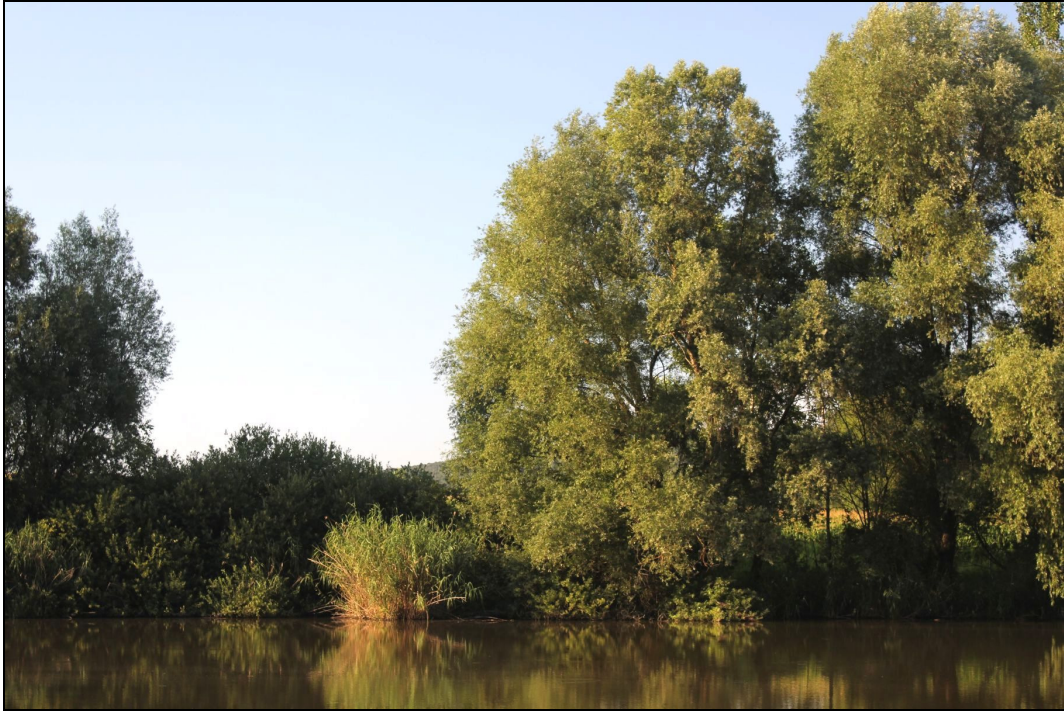
1.5. Fűzes sáv a Barátok tava partja mentén.