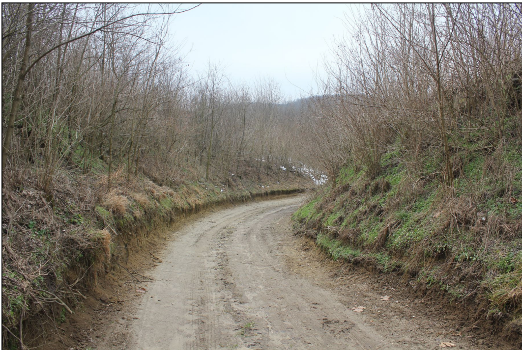
1.4. Mélyút szakasz a Barátok tava mellett elhaladó középkori út mentén. Az út a középkori (később elpusztult) Szentpéter egyházas falut és Püspökszékelyt (a mai Nagyszékelyt) kötötte össze, miközben elhaladt a mára szintén eltűnt Temerkény nevű település mellett.