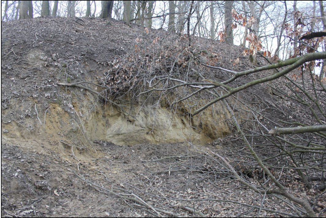
1.3. A Barátok pincéjének ma már csak beszakadt bejárata látszik.