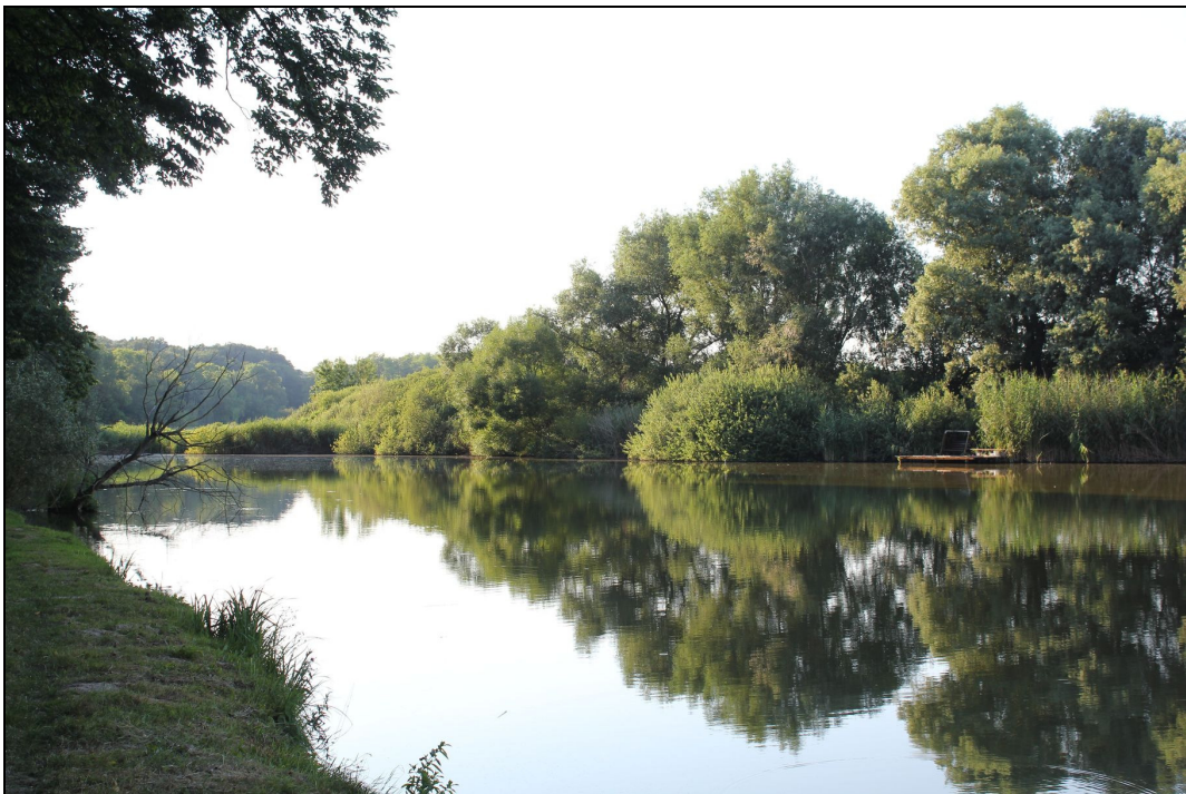
1.6. A Barátok tavát övező változatos élőhelyek természetes vagy természetközeli állapotúak.