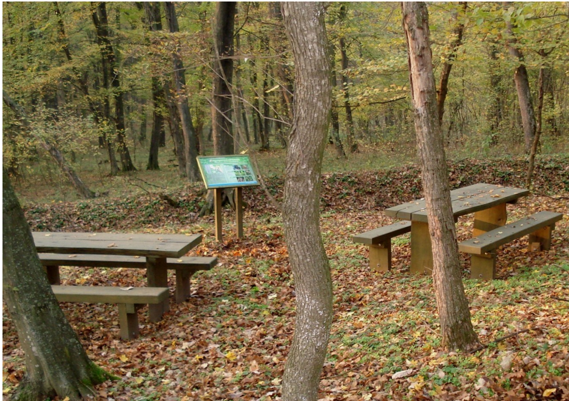
A Kökény körút 6. állomása a Kiszékelyi-erdő szélén