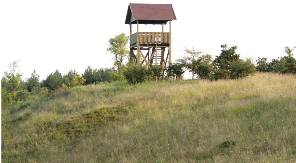
A Kilátó a Dukai hegyen, a Berkenye körút mentén