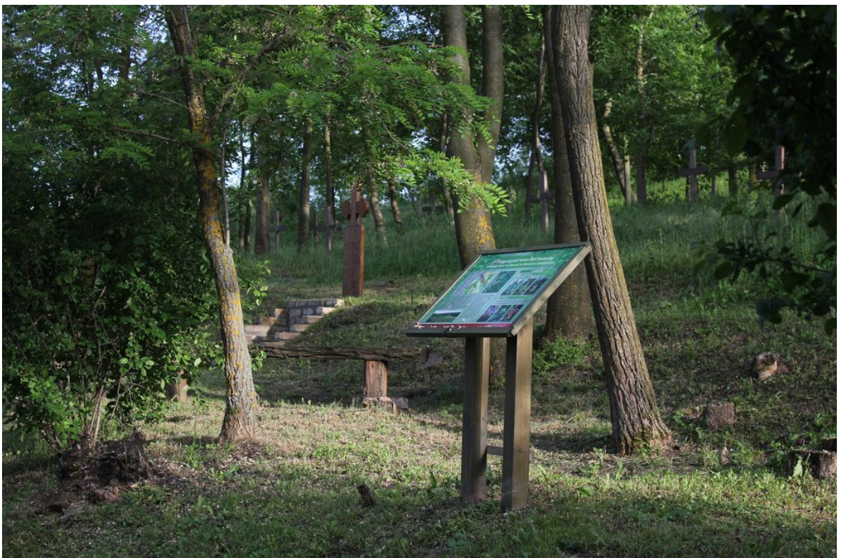
A Galagonya körút a 16. állomása