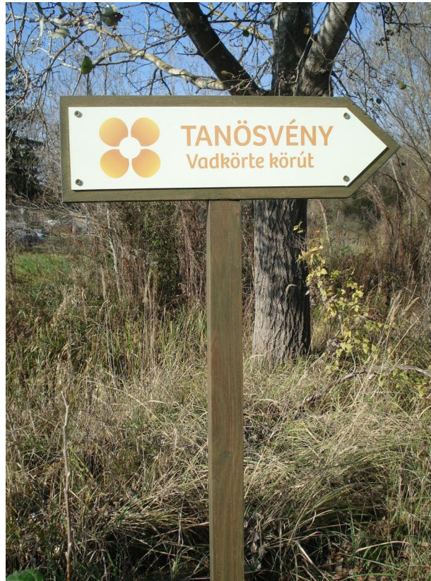
A Vadkörte körút egyik útbaigazító táblája