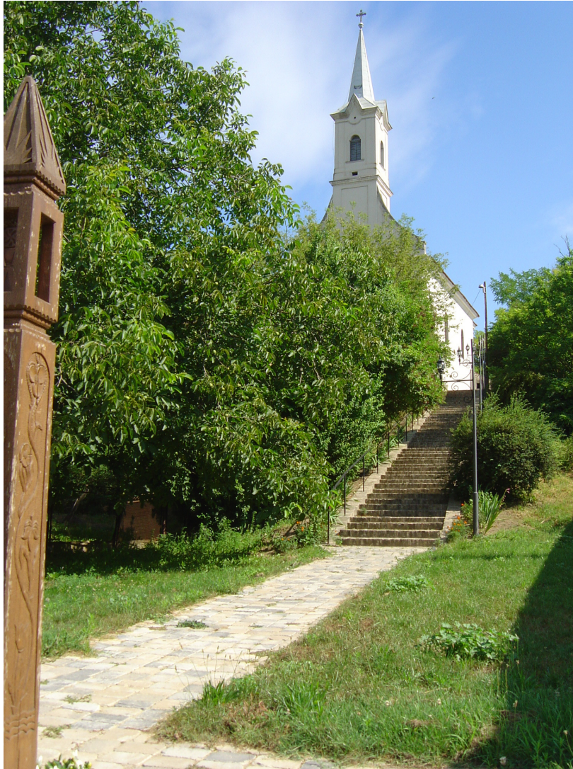
Felújított templom lépcső

Készítette: Csepregi Ferenc Kisszékelyi kulturális Egyesület