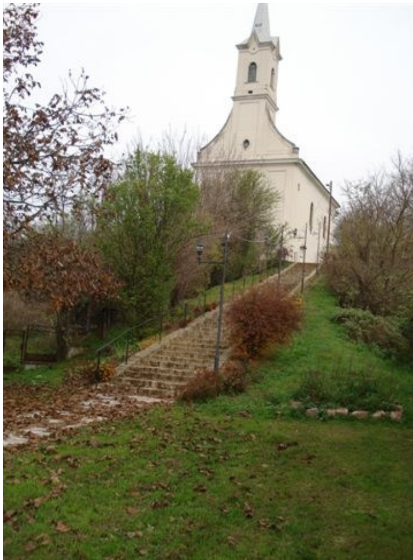
Templom lépcső és a templom