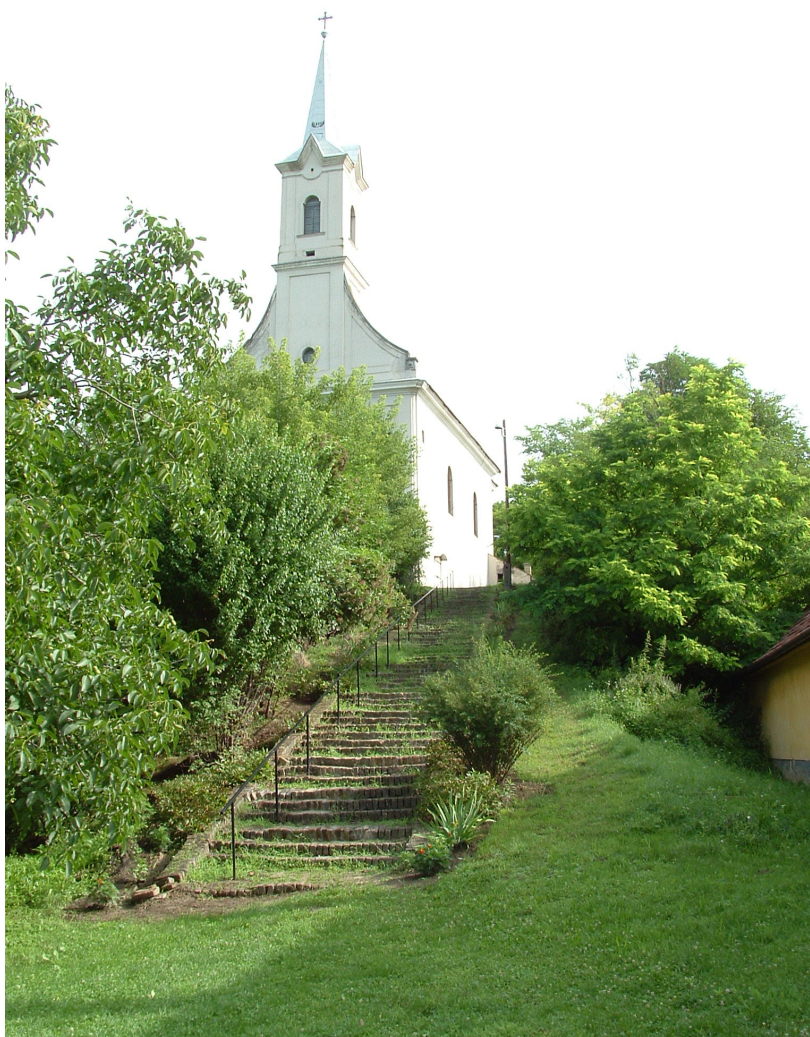
Templom lépcső a felújítás előtt.