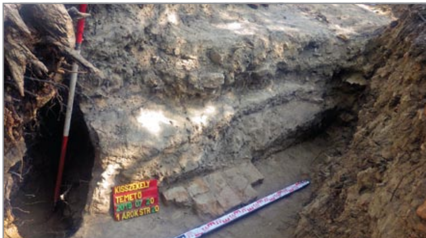
Eredeti helyzetben lévő téglák az északi hajófal alapozó árkában