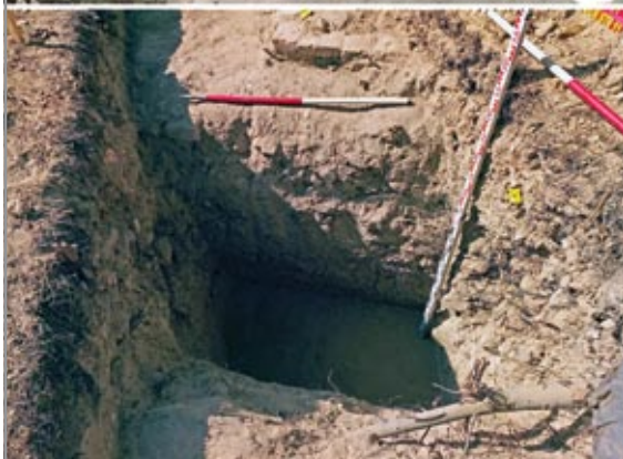
A templom északi falának alapozó árka jobbra lent A félköríves szentély északról balra lent