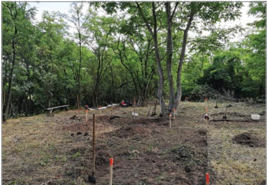
A domboldalban lévő plató az ásítás első napján