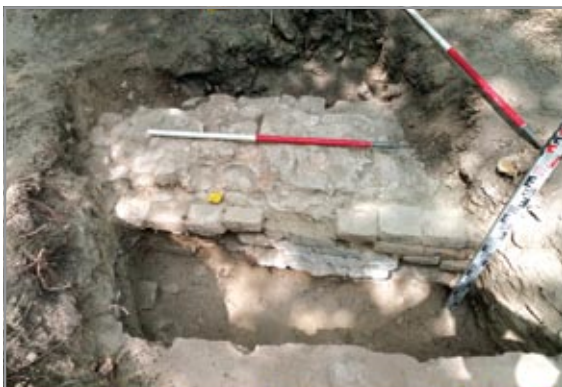
A sekrestye északi fala, és későbbi javítása (felül) Az U alakú barokk bővítmény északi falának alapozó árka (alul)