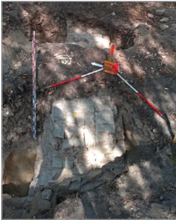
A hajó déli falának nyugati sarka északról